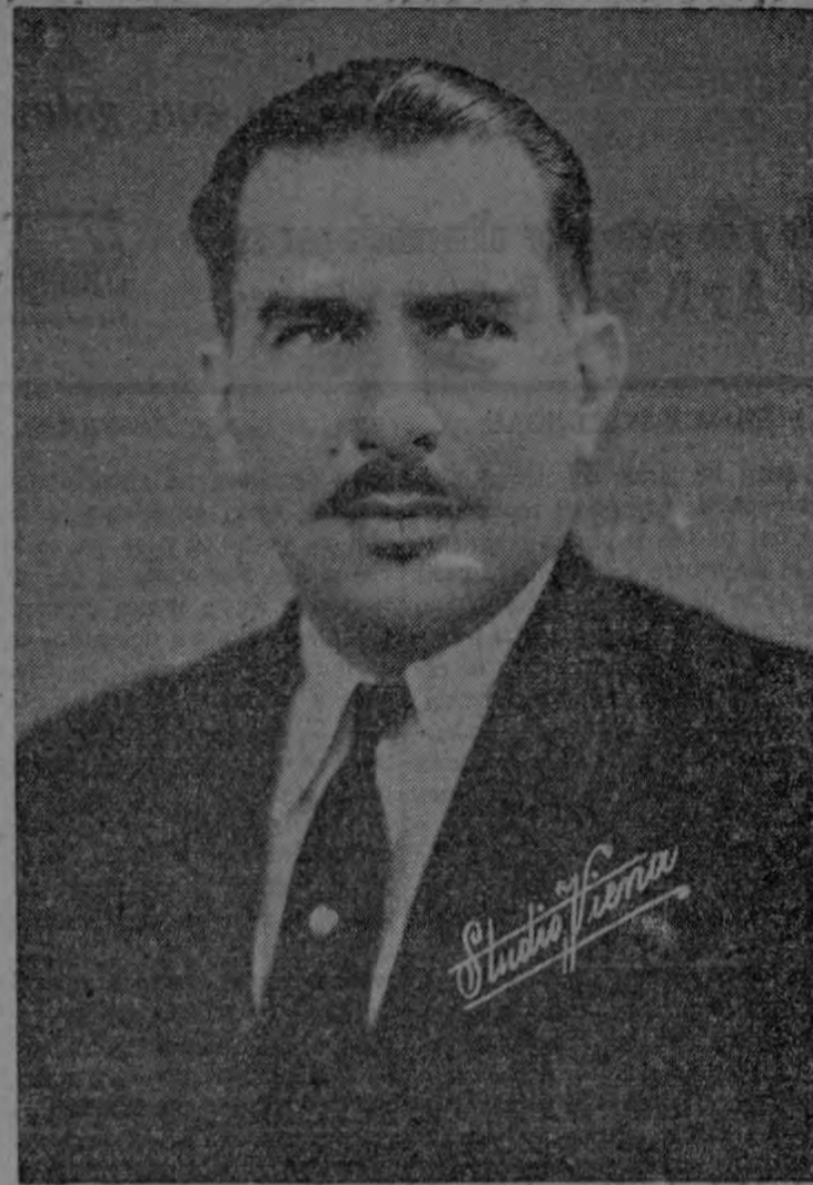
Licenciado don TEODORO PICADO Presidente de la República

La autoridad política dará al solicitante recibo de la solicitud y dentro de las cuarenta y ocho horas siguientes a la presentación de ésta, pasará las diligencias al Registro, acompañadas de un informe suyo relativo al conocimiento que tenga el solicitante y de la exactitud de sus declaraciones. El Registro también dará recibo de las diligencias a la autoridad que las pade, y el Registrador General procederá sin demora al examen de ellas, para extender el respectivo asiento de inscripción, si procediere conforme a la ley.